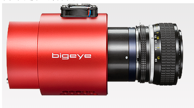
产品实物外观图/接口部分图

Bigeye P-629B Solar Cool 相机是德国 Allied Vision Technologies 生产的一款在可见光谱和近红外光谱均有极佳响应的工业相机。此相机搭载 ON Semi KAF-6303E 图像传感器，增强了在近红外光谱范围的灵敏度，低噪声可以获得信噪比极佳的高质量图像。紧凑型设计，在 629 万像素 像素分辨率下能高清显示在线清晰图像，色彩还原极佳，每秒输出 0.67 帧 图像，画面非常流畅。制冷型摄像机坚固紧凑的金属机身内有一节密闭的真空部分，确保了这款产品即使是在恶劣的环境中运行多年仍无需进行维护。此款近红外工业相机属于 AVT 的 Bigeye 系列，主动制冷 CCD，千兆网接口，Peltier 半导体制冷，即便在长时间曝光的情况下也能为用户提供优质的低信噪比图像，非常适合对使用条件非常苛刻的红外成像应用，如低光显微镜或对光敏材料进行无损探伤等非常理想的选择。